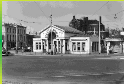
Het wachtje op het Rijswijkseplein

Eerst op het Alberdingk Thijmplein bij buurthuis de Fram ( geen foto beschikbaar ) later op het Rijswijkseplein bij het Wachtje, en daarna in een zijstraat van het Alberdingk Thijmplein.