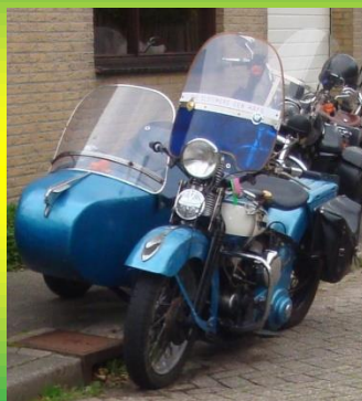
Zo is de Harley nu.