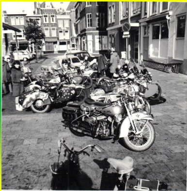
Hier staan we bij Florencia in de Torenstraat te Den Haag.

Tourritten werden soms afgesproken en soms spontaan bij goed weer gereden, verzameld werd er bij Abspoel thuis of bij het wachtje of ook vaak bij Florencia.