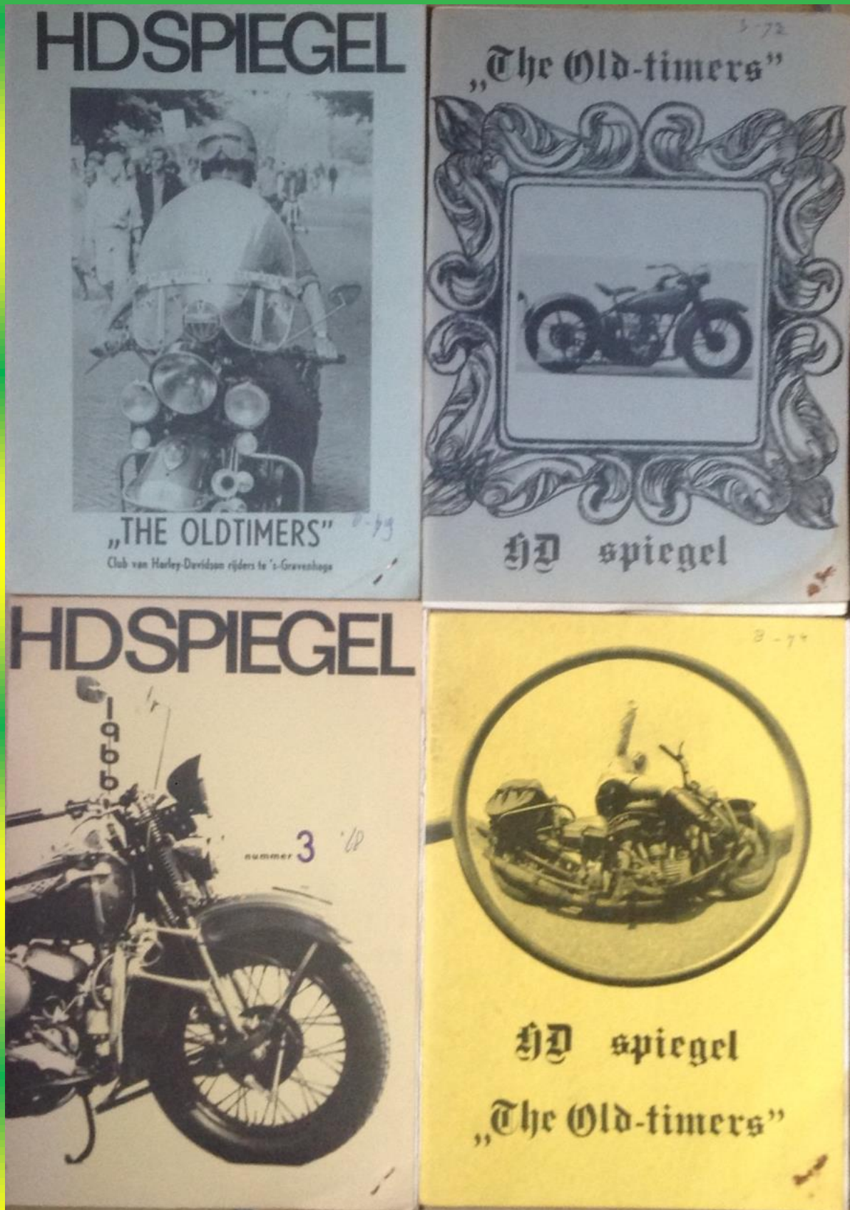
Diverse covers van de spiegel in de 60er en zeventiger jaren .