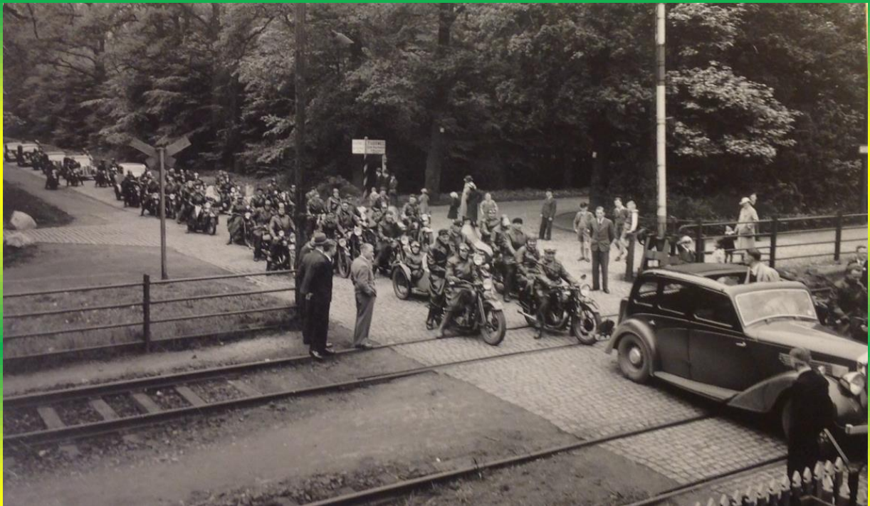
Toerit van de Haagsche H-D club rond 1937.