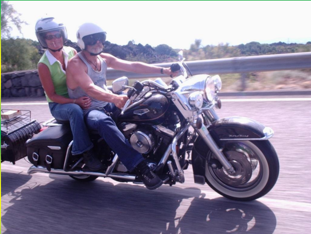
Foto boven: een dag trippie op Sicilië, Mar voor de gein ff niet op d'r eigen motor, kissie sigaren op de Paf.

Door naar zuid-west Sicilië, enorm koud water daar, maarrrrr heerlijke pizza's.