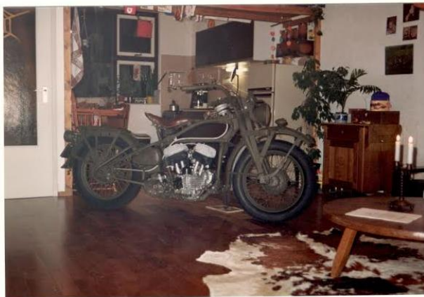
De Buzzzzz werd opgebouwd in de woonkamer, lekker warm en wel zo gezellig.