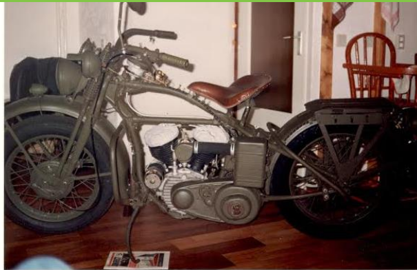
december 1982, bijna klaar