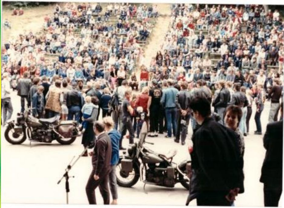
Grote belangstelling in Polen op de tribunes voor onze behendigheid wedstrijdjes.