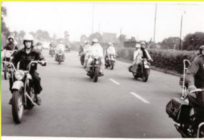
Rondrit in Wolsztyn in 1974.